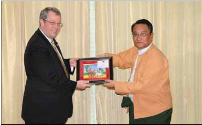
အလတ်စား လုပ်ငန်းများ၊ အပင်နှင့် ပိုးမွှားရောဂါကင်းစင်ရေး (SPS) နှင့် သယ်ယူပို့ဆောင်ရေး (Logistics) ဆိုင်ရာ ကိစ္စရပ်များတွင် ကူညီထောက်ပံ့ပေးနိုင်ရေး၊ နှစ်နိုင်ငံဆက်ဆံမှုတွင် အစိုးရအချင်းချင်းသာမက စီးပွားရေးလုပ်ငန်း

စီးပွားရေးနှင့် ကူးသန်းရောင်းဝယ်ရေးဝန်ကြီးဌာန၊ ပြည်ထောင်စုဝန်ကြီး ဒေါက်တာသန်းမြင့်သည် ဇူလိုင် ၂၅ ရက်၌ အမေရိကန်ပြည်ထောင်စု၊ တက္ကဆတ်ပြည်နယ်၊ ရထားပို့ဆောင်ရေးကော်မရှင် ဥက္ကဋ္ဌ Mr. David Porter ဦးဆောင်သော ကိုယ်စားလှယ်အဖွဲ့အား စီးပွားရေးနှင့် ကူးသန်းရောင်းဝယ်ရေးဝန်ကြီးဌာန၊ ဝန်ကြီးရုံး အစည်းအဝေးခန်းမ၌ လက်ခံတွေ့ဆုံသည်။