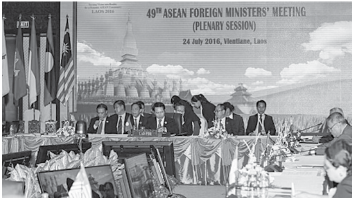
“သဘောတူညီချက်အရ အာဆီယံ အဖွဲ့ဝင်နိုင်ငံတွေဟာ ဘုံအကျိုးစီးပွားကို ညီညီညွတ်ညွတ် ကာကွယ်ဆောင်ရွက်နေတယ်ဆိုတဲ့ အချက်ကို ပြသလျက်ရှိနေတာကို တွေ့ရပါတယ်” လို့ အင်ဒိုနီးရှားနိုင်ငံခြားရေးဝန်ကြီး ရက်တနီမာဆုဒီက ပြောပါတယ်။

(၄၉)ကြိမ်မြောက် အာဆီယံ ဝန်ကြီးအဆင့် အစည်းအဝေး (AMM) ကို လာအိုနိုင်ငံ ဝီယင်ကျန်းမြို့မှာ ဇူလိုင် ၂၆ ရက်က ကျင်းပပြီးဆုံးခဲ့ပါတယ်။ အစည်းအဝေးအပြီးမှာ တောင်တရုတ်ပင်လယ်ပြင်နယ်မြေ အငြင်းပွားမှုနဲ့ပတ်သက်ပြီး ပူးတွဲကြေညာချက်ကို ထုတ်ပြန်ခဲ့ပါတယ်။