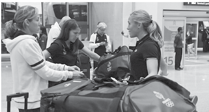
တော်ဆိုင်ကယ်များ၊ ရဟတ်ယာဉ်များဖြင့် လိုက်ထိန်းစစ်ဆေးခံရသည့်ဟု ဆိုသည်။ ထို့ပြင် အဆိုပါပြင်သစ်အသင်း လေ့ကျင့်ရေးကွင်းများသို့ သွားရောက်သည့်အချိန်တိုင်းတွင်

ထို့ပြင် ပြင်သစ်အသင်း တည်းခိုနေထိုင်မည့် ဟိုတယ်သို့ လေဆိပ်မှသွားရောက်ရာလမ်းကြောင်း တစ်လျှောက်တွင်လည်း ဘရာဇီးရဲတပ်ဖွဲ့က မော်